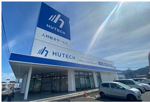
ヒューテック本社

<本件に関するヒューテックおよびビジネス・サービスの取引先さまおよび就業中スタッフの方からのお問い合わせ先>