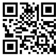
メールアドレス登録用 QRコード